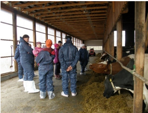
Parrenpielipäivä Polvijärvellä 20.4.2016