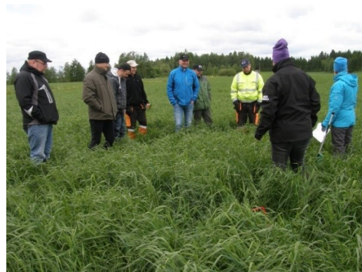
Nurmiviljelyn tehostaminen-pellonpiennarpäivä Nurmeksessa 6.6.2016