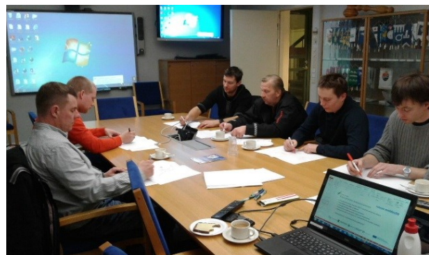
Nurmiryhmän aloitus 20.12.2016 Lieksassa