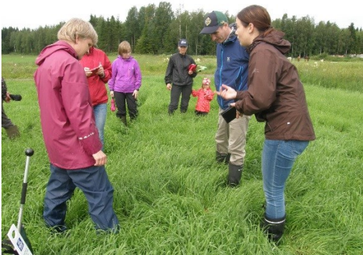
Nurmiryhmä laitumella 5.7.2016 Liperissä

Koko vuoden 2016 aikana hankkeen varsinaisiin koulutuksiin osallistui 43 tilalta yhteensä 93 eri henkilöä, joista 36 naista ja 57 miestä. Osallistujia koulutuspäivissä oli yhteensä 170 henkilöä ja oppitunteja järjestettiin hankkeessa yhteensä 103 kpl x 45 min. Osa yrittäjistä osallistui useampiin tilaisuuksiin.