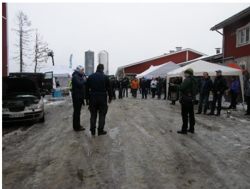
Koivikon kartano 18.11.2015

Jaksolla hahmoteltiin hankkeen lomake- ja ohjelmapohjia, tausta-aineistoja ja esittelymateriaalia. Valmisteltiin koulutusaiheita, haettiin tietoa ja materiaaleja koulutuksiin, kartoitettiin kouluttajia ja keskusteltiin yrittäjien kanssa koulutustarpeista mm. Koivikon kartanon avoimissa ovissa 18.11.2015 ja Mansikka-ahon avajaisissa 8.12.2015. Varsinaisia käytännön toimia ei tehty, sillä hankehakemusten käsittely Pohjois-Karjalan ELY-keskuksessa oli vasta käynnistynyt.