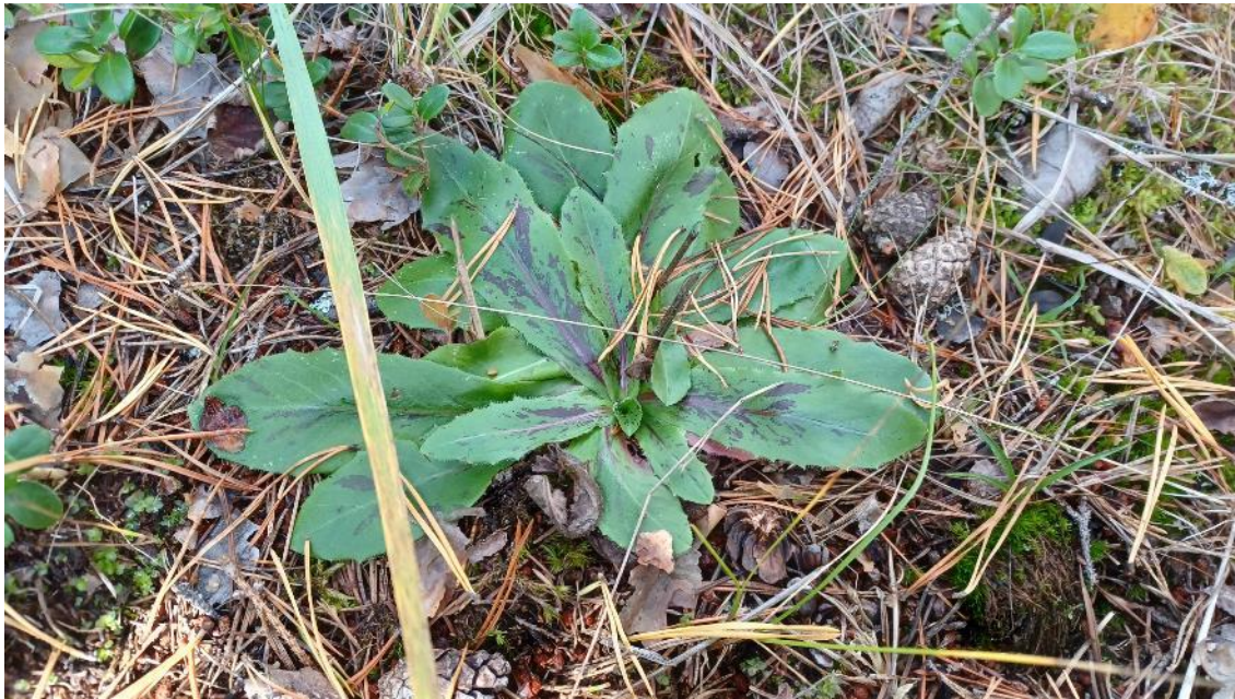
Häränsilmä, kartioakankaali, ...