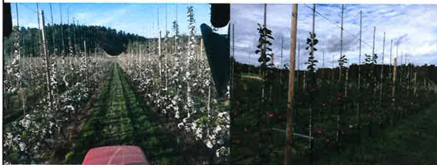
Fredrik Björklund / FHS