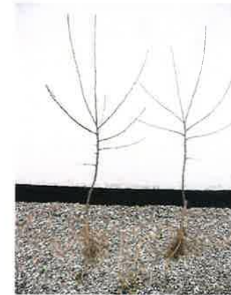
Fredrik Björklund / FHS