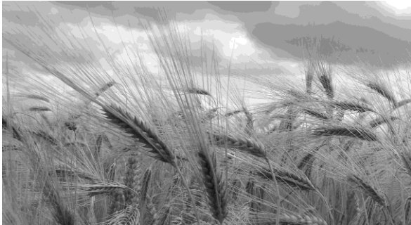
Kotimaiset mallasviljat (ohra ja vehnä)